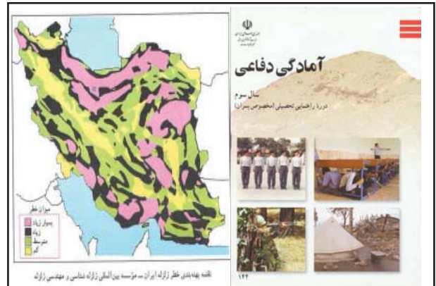
شکل ۲: نقشه موقعیت بم از لحاظ زلزله خیزی در کتاب سوم راهنمایی

احتمال بحران زلزله در این منطقه، مورد توجه قرار دهد ۱ (شکل ۲).