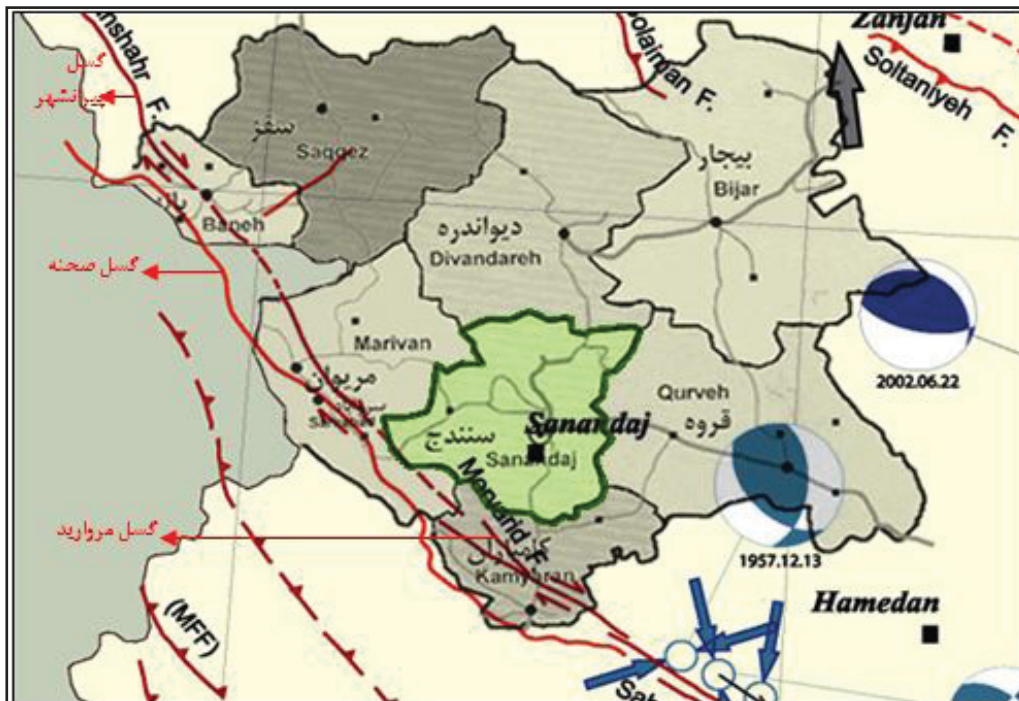
شکل ۳. موقعیت گسل‌های واقع در محدوده اطراف شهر سنندج

است. گسل پیرانشهر در امتداد دامنه غربی دره رودخانه زاب کوچک یک مرز ساختاری ایجاد نموده است. رشته کوهی با بیش از ۲۵۰۰ متر ارتفاع در اثر عملکرد این گسل شکل گرفته است. جابجایی قائم در امتداد این گسل بیش از ۱۰۰۰ متر می‌باشد. گسل‌های جنبی دیگر در منطقه زاگرس که بر منطقه عمومی سنندج از نظر لرزه خیزی مؤثر می‌باشند شامل گسل سنته، گسل شمال سنندج، گسل شمال شرقی سنندج، گسل کانی شاه در شمال غرب سنندج و گسله کوچک سر در غرب سنندج. بر حسب آمار موجود توزیع جغرافیایی زلزله‌ها در جنوب و جنوب غربی ایران یعنی امتداد زاگرس شمالی و جنوبی از نظر تعداد