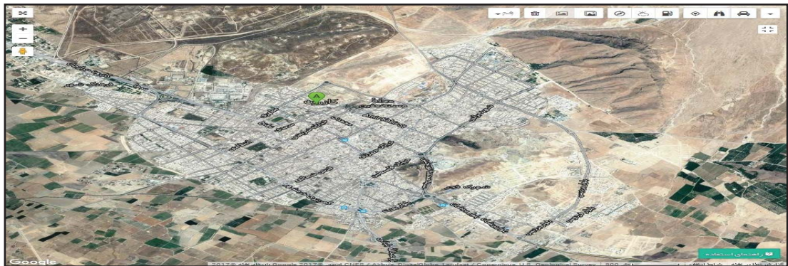
شکل ۱ و ۲: موقعیت ناحیه مورد مطالعه (قسمت دایره‌ای) بر روی نقشه (www.google.com/maps)